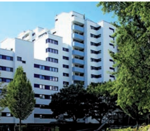
Πλαίσια με ενσωματωμένους αεραγωγούς σε χρώμα μπλε του Κοβαλτίου – δείχνουν όμορφα, βελτιώνουν την ζωή και εξοικονομούν ενέργεια

Παρά τις γενικές δύσκολες συνθήκες της αγοράς, η Ευρωπαϊκή βιομηχανία PVC διατήρησε την αποφασιστικότητά της για την επίτευξη των στόχων βιωσιμότητάς της και το 2009.