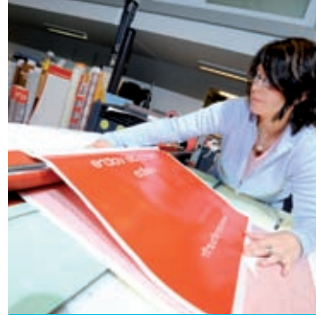
O parte integrală a comunicațiilor moderne

A doua ediție a Concursului de Eseuri al Vinyl 2010, care a implicat generația mai tânără în dialogul privind dezvoltarea durabilă, a fost extrem de reușită. Rezultatele concursului de eseuri au fost