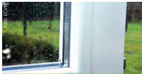
Plastová okna přispívají k šetření zdrojů a energie

Udržitelné využívání energie: Pomůžeme k minimalizaci dopadů na změny klimatu prostřednictvím snížení spotřeby energie a surovin, potenciální snahou přejít na obnovitelné zdroje, a podporou udržitelných inovací.