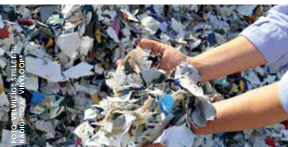
PVC-belagt tekstilaffald fra Serge Ferrari der skal til genanvendelse i VinylLoop®-fabrik i Ferrara, Italien

Som en del af PVC-industriens indsats med at bruge innovativ teknologi til at genanvende 100.000 tons p. år af vanskeligt genanvendelsesbart PVC besøgte udvalget EcoLoop-værket i Tyskland ( www.ecoloop.eu/en ) og Alzchem( www.alzchem.com ) -kalcium-karbid-værket i Bayern. Workshops med deltagere fra teknologiske institutter, virksomheder og organisationer blev også afholdt i 2013, og adskillige interessante veje til undersøgelse og udvikling blev identificeret.