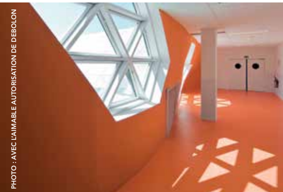
Revêtements de sol en PVC : meilleur confort de marche, réduction efficace des bruits de pas, antidérapant, chaud, grande résistance à l'usure

Utilisation durable de l'énergie : « Nous nous emploierons à minimiser les impacts sur le climat en réduisant notre consommation d'énergie et de matières premières, en nous efforçant de passer à des sources renouvelables et en favorisant l'innovation durable. »