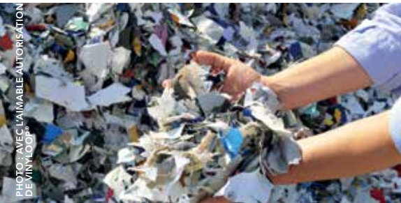
Déchets de tissus enduits PVC de Serge Ferrari destinés au recyclage à l'usine VinyLoop® de Ferrare en Italie

Dans le cadre des efforts déployés par l'industrie du PVC visant à utiliser des technologies innovantes pour le recyclage de 100 000 tonnes/an de PVC difficile à recycler, le Comité a visité l'usine d'EcoLoop en Allemagne ( www.ecoloop.eu/en ) et l'usine de carbure de calcium d'Alzchem ( www.alzchem.com ) en Bavière. Des ateliers, réunissant des représentants d'instituts de technologie, d'entreprises et d'associations, ont aussi permis d'identifier plusieurs pistes intéressantes dans le domaine de la R&D.