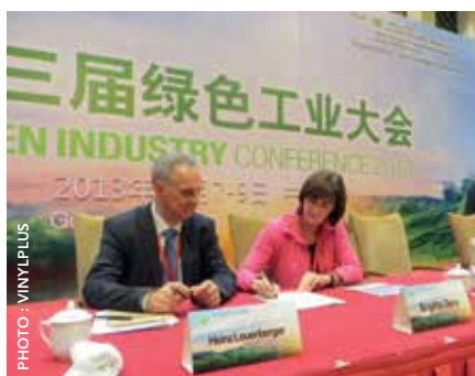
Signature officielle de la Déclaration de Soutien à la Green Industry Platform

Sensibilisation au développement durable : « Nous continuerons à développer la conscience du développement durable chez tous les acteurs de la chaîne de valeur – tant internes qu’externes à la profession – pour répondre plus rapidement à nos défis dans ce domaine. »