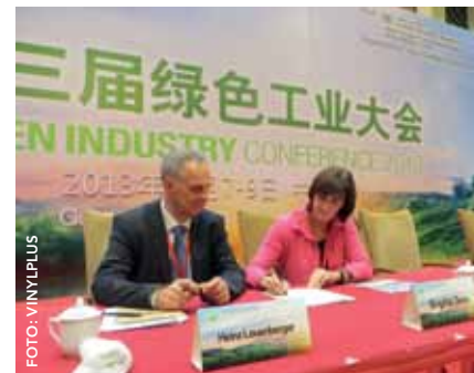
Firma ufficiale della Dichiarazione di Supporto della Green Industry Platform

Consapevolezza della sostenibilità: "Continueremo a costruire la consapevolezza della sostenibilità lungo la filiera – coinvolgendo gli stakeholder interni ed esterni all'industria – per accelerare la soluzione delle nostre sfide per la sostenibilità."